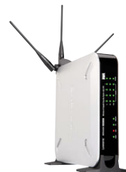
Router di sicurezza